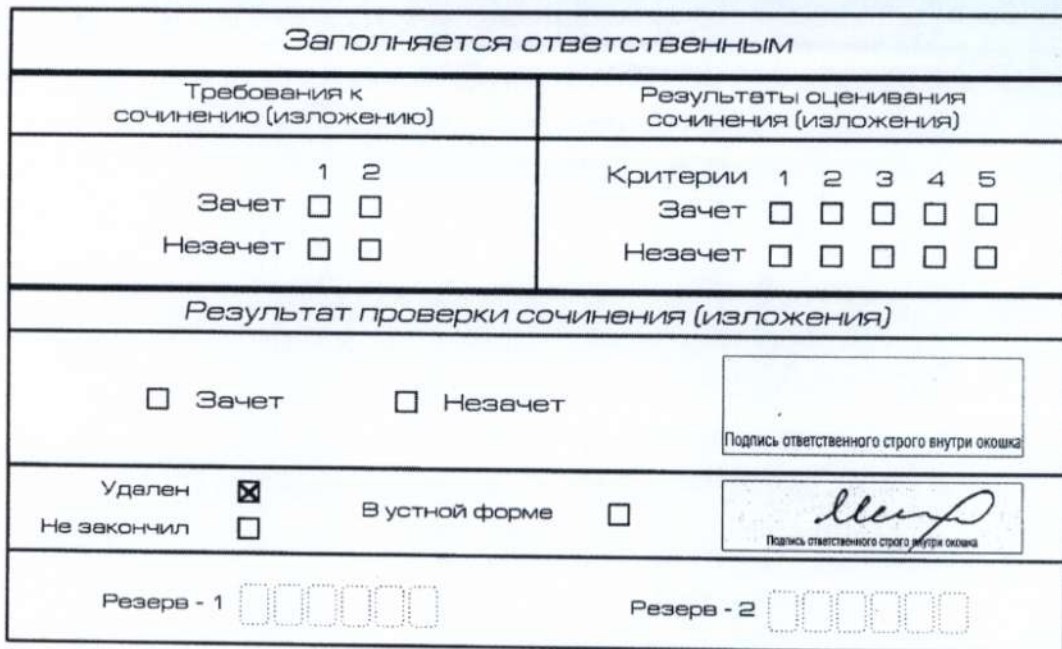
Рис. 13. Заполнение полей нижней части бланка регистрации (удаление с экзамена)